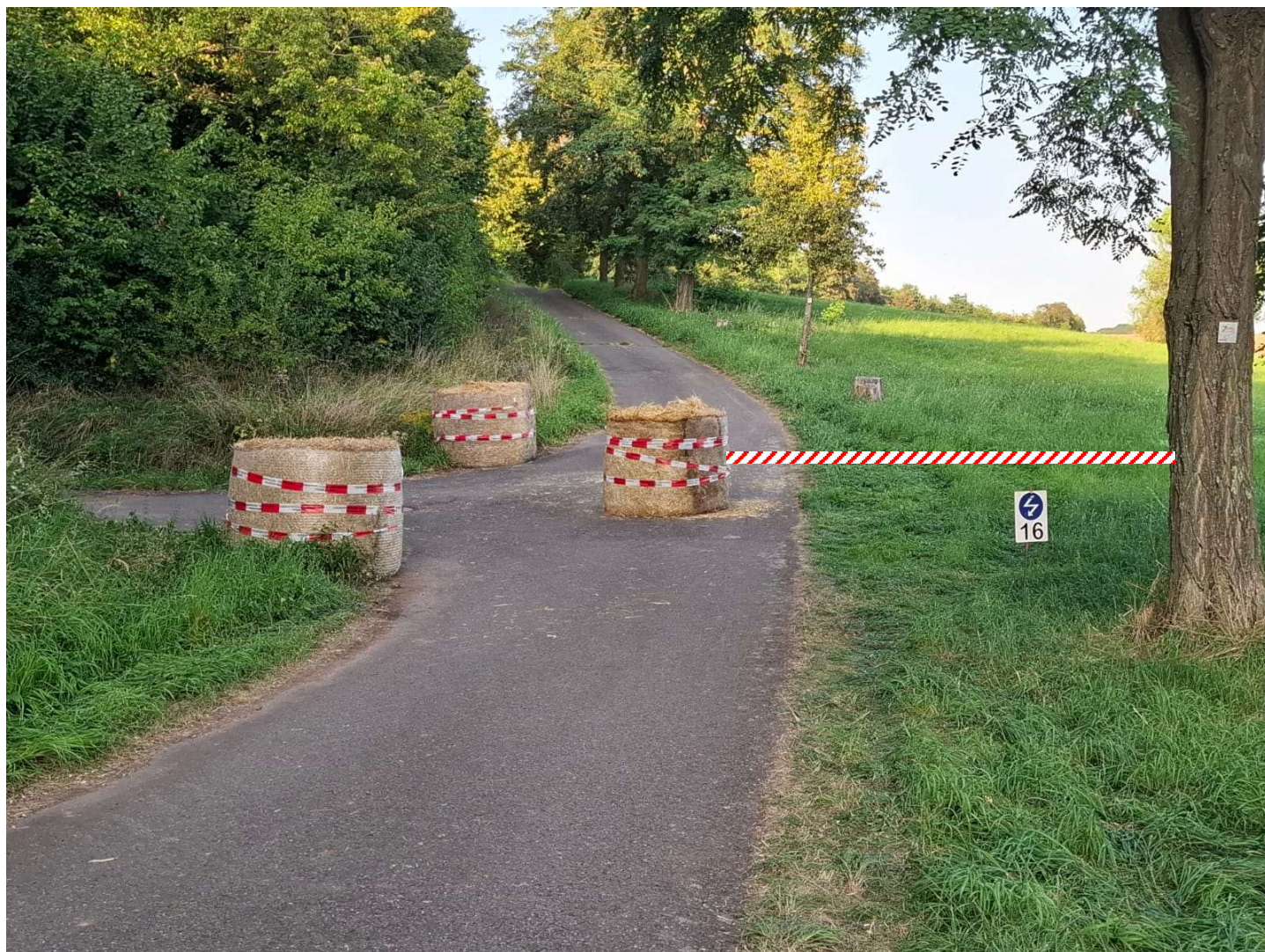
Marc STOLL Rallyeleiter [clerk of the course]

Die Schikane im Roadbook auf Seite 120 – Box 48 ist bei der Besichtigung bereits aufgebaut und auf dem Boden markiert. [The chicane in the roadbook on page 120 – Box 48 is already set up during the recce and marked on the ground.]