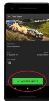
Click accept invite.

Die RS-Lite-App müssen im Besichtigungszeitraum, während dem Shakedown und während dem Wettbewerb (mit Ausnahme im Parc Fermé) permanent aktiv geschaltet sein. Ein inaktiv geschaltetes