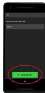
Click add event.