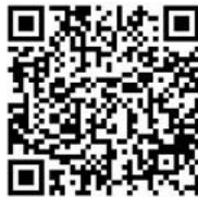
(Google Play Store)