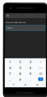
Enter unique code.