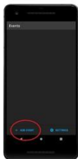
Main Screen when app is opened. Click "add event".

When you arrive and check in at the event, each car number will be given a unique code to enter into the app.