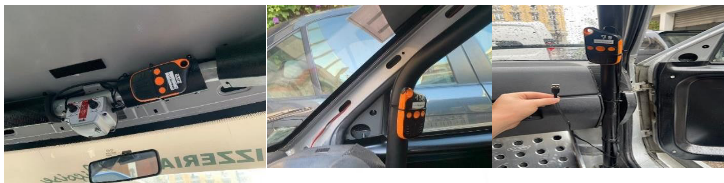
Câble Alimentation fourni par VDS 80 cm

ATTENTION prévoir suffisamment de longueur de câble pour avoir accès aux 2 emplacements obligatoires du boîtier ou utiliser une rallonge USB