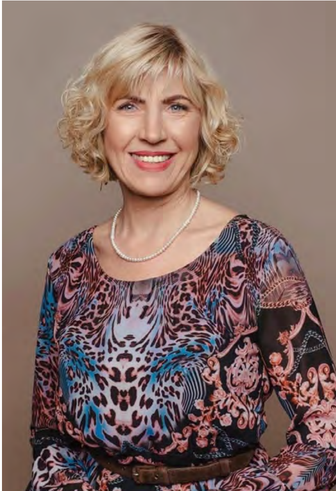
Zarasų rajono savivaldybės merė