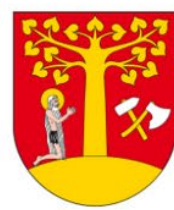
Szymon Duman Wójt Gminy Stryszów