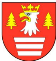
Józef Balos Starosta Suski

Witold Kozłowski Marszałek Województwa Małopolskiego