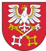
Eugeniusz Kurdas Starosta Wadowicki