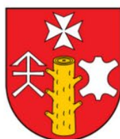
Łukasz Palarski Wójt Gminy Zembrzyce