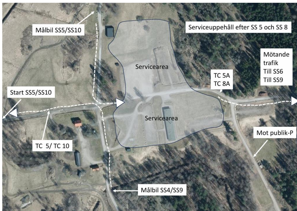
Figur 2 – Serviceplats lördag