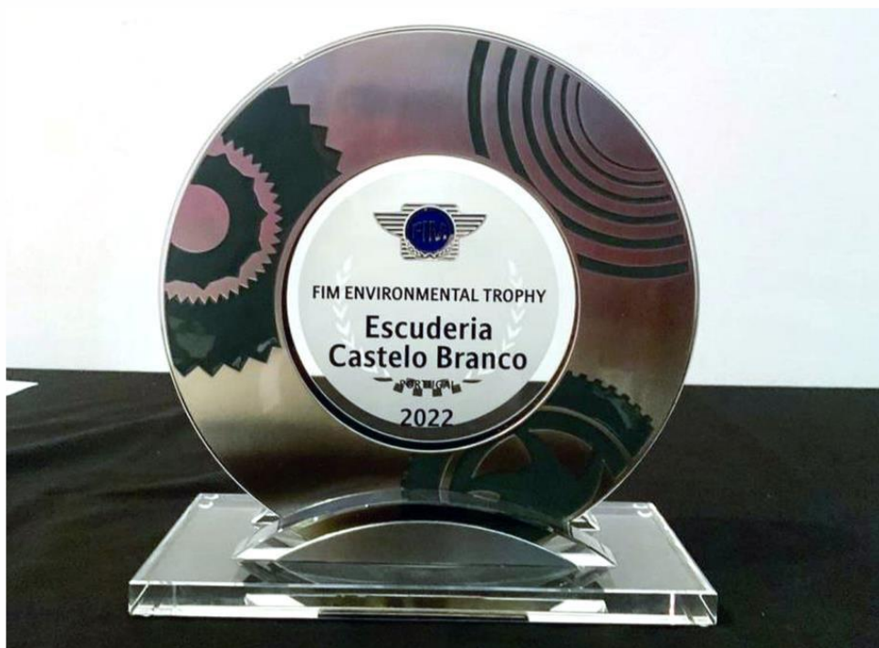
Atribuição Prémio Internacional FIM