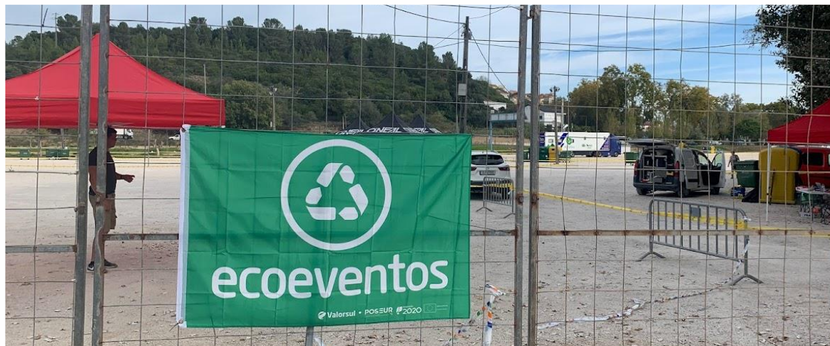
Atribuição do título de Ecoevento