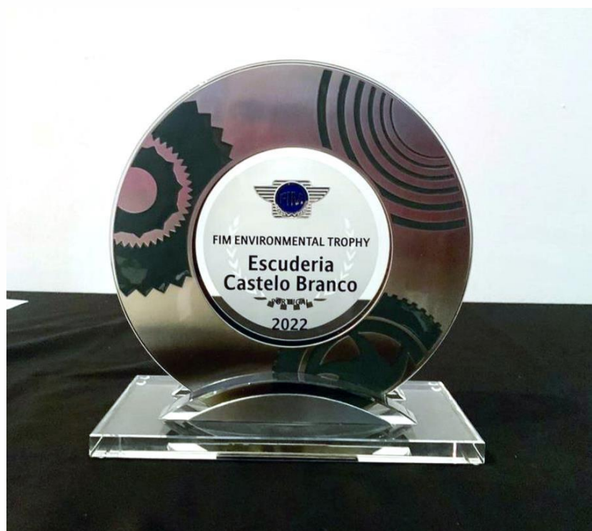
Atribuição Prémio Internacional FIM