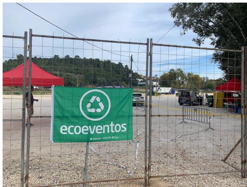
Atribuição do título de Ecoevento