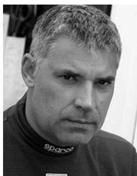
Офицер по связи с участниками