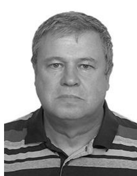
Офицер парка сервиса Тех. контролёр (Ст. судья бригады)

A24-160 ВК Ленинградская обл. +7 921 935 01 41