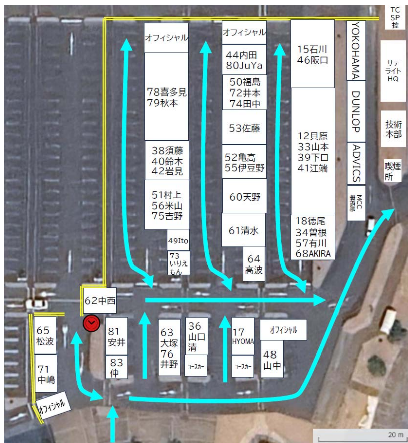
サービスパーク西エリア